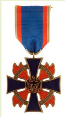
Deutsches Feuerwehr-Ehrenkreuz, Bronze