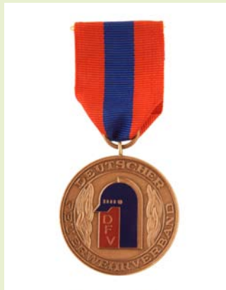
Medaille für internationale Zusammenarbeit, Bronze